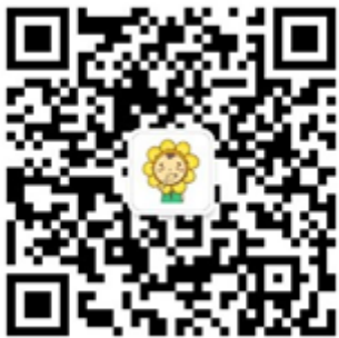
阳光健康生活微信公众号二维码